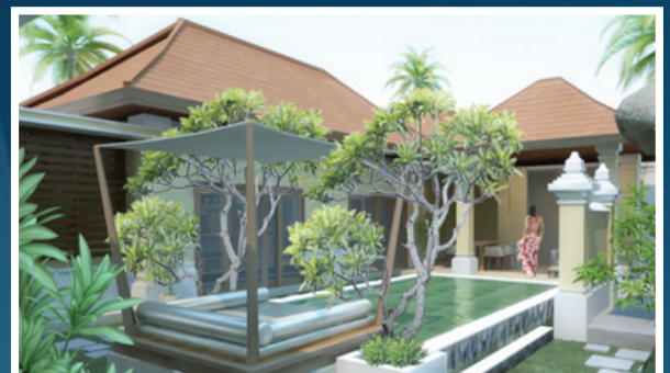
TYPE TWO BEDROOM VILLA