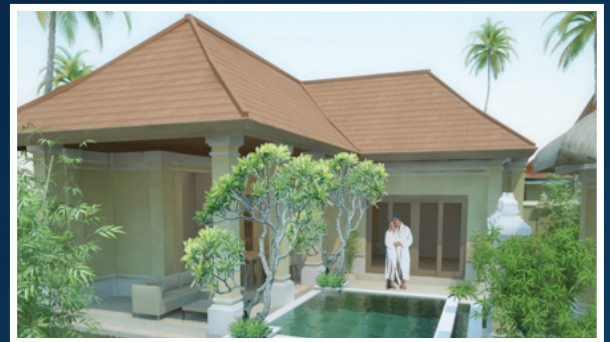
TYPE ONE BEDROOM VILLA

C2. Honey Moon Villa * Villa nr. 2 € 128.000,- Land size : 310.00 m 2