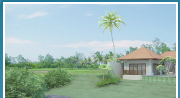
TYPE HONEYMOON VILLA

* DEVA property Wiwiek Wiratha, 06 51843201 www.devagroup.nl info@devagroup.nl